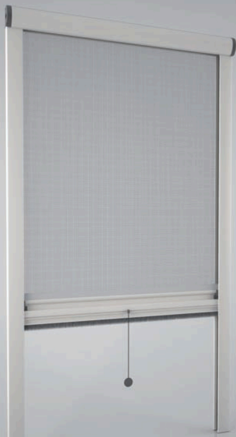
Versione 1 Standard